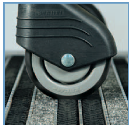
Rengöring av hjul Tread cleaning

Askims Skytteväg 4A · SE-436 51 Hovås · Sweden Tel: +46(0)31 28 50 90 · Fax: +46(0)31 28 50 90 E-mail: info@gentus.se · Internet: www.gentus.se