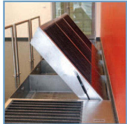
Rengöring är enkelt eftersom gasfjädrar hjälper till att öppna enheten Cleaning is made easy due to gas struts which open the gate effortlessly