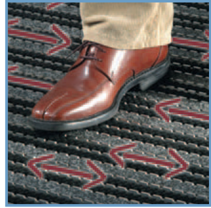
Riktning på borstarnas rörelser Direction of movement of the brushes