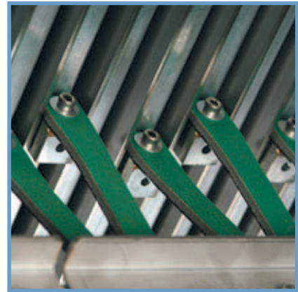
Hela enheten är underhållsfri eftersom rörliga delar sitter skyddade från smuts The entire unit is free of maintenance as the drives are dirt-protected