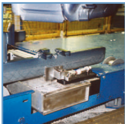
Vaxavskrapare Wax scrapers