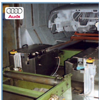
Anläggning för skid-rengöring Skid cleaning unit.