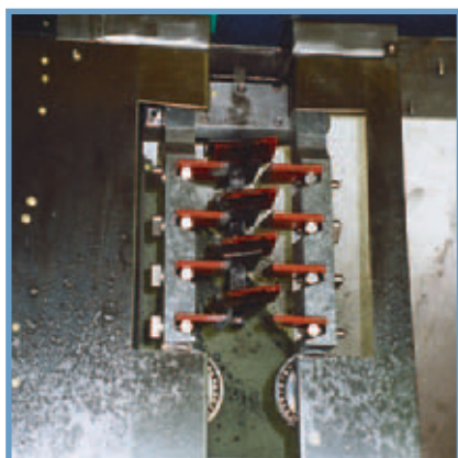
Borstar som åker med Wipers carried along with the skid