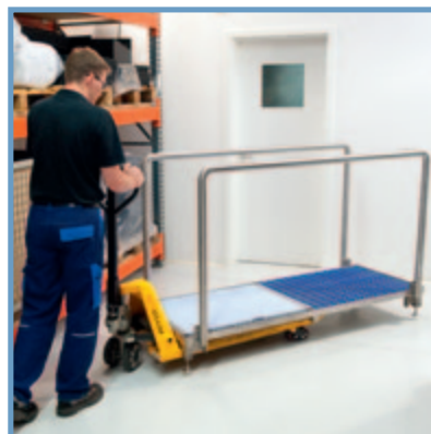
Flyttbar med pallyftare / Mobile due to fork lift pick up