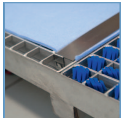
DryPad sätts enkelt fast med två klämmor och går snabbt att byta ut / The Drypad is easily fixed with 2 clips and can be quickly replaced