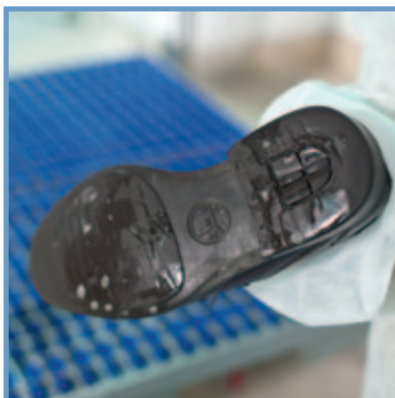
Våt rengöring och desinfektion / Wet cleaning and disinfection