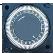
Timer 24 h repeat