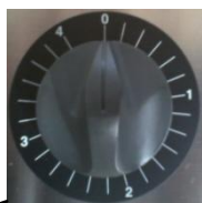
Timer 0-4 h

Handtagen värms försiktigt upp. Samtidigt ventilerar en luftström ut den fuktiga luften. Torkningen blir mycket skonsam och passar alla material och typer av skodon.